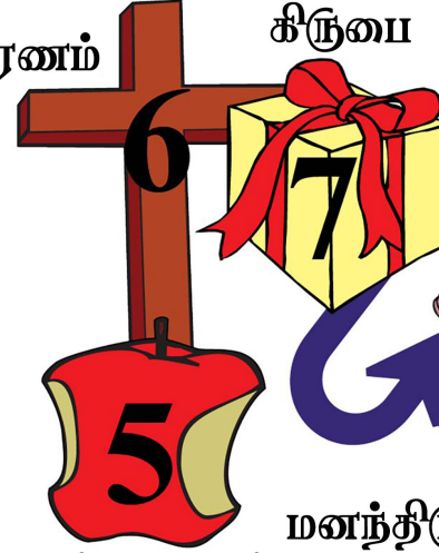
ஜென்ம பாவம் தனிப்பட்ட பாவம்

நீதிமானாக்கப்படுதல், மறுபிறப்பு, புத்திரசவீகாரம்