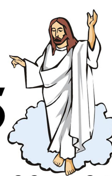
கிறிஸ்துவின் இரண்டாம் வருகை