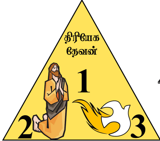
இவ்வாச கிறிஸ்து பரிசுத்த ஆவிப்பானவர்